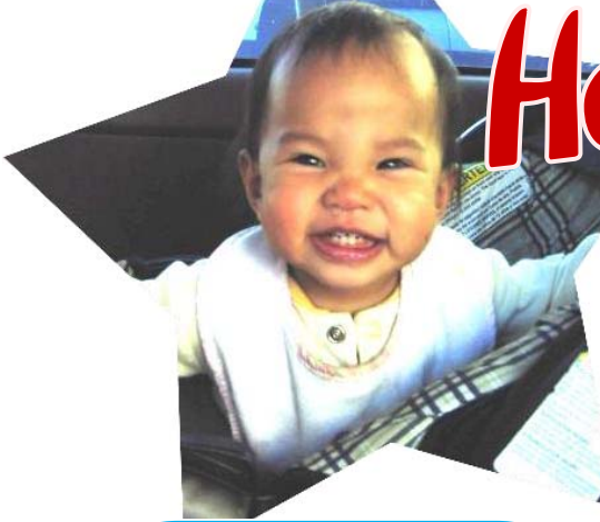
◆ Baby Roo's Mommy